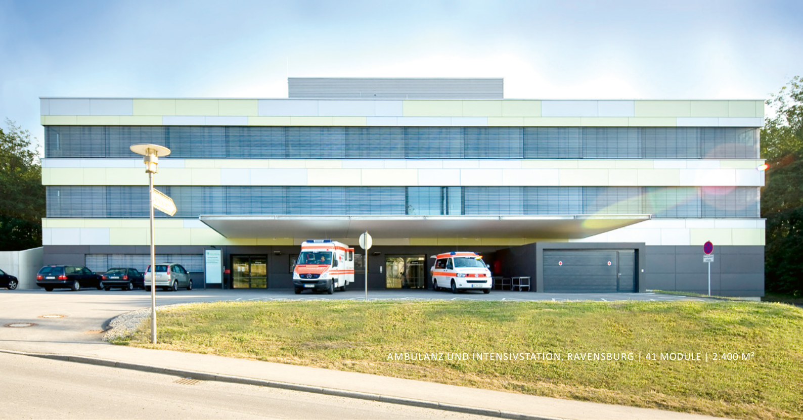
AMBULANZ UND INTENSIVSTATION, RAVENSBURG | 41 MODULE | 2.400 M 2